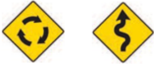
Коло Небезпечні повороти