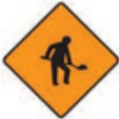
Дорожні роботи попереду