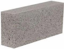
100 x 220 x 450 mm solid concrete building block

Ní mór mais fhíor iomlán de 800kg a bheith ann nuair a chuirtear an leantóir i láthair, ag féachaint go cuí do shábháilteacht, seasmhacht, treoirilínte an mhonaróra agus uasteorainneacha dlíthiúla an chónaisc.