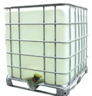
Example of an IBC

Is féidir coimeádáin darb ainm IBCanna (bulcchoimeádán idirmheánach) a chur ar an bhfeithicil leis an luchtú ar an bhfeithicil a bhaint amach. Tá toilleadh shonraithe ag IBCanna agus mar sin tá siad úsáideach chun meáchan tugtha a chruthú. Mar shampla, beidh meáchan 1,000 kg (1 tonna) in IBC